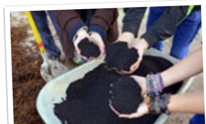
↓ Soilution - Erde mit Zukunft, HLFS Ursprung

Kurz gesagt: alles. Es ist ganz egal, ob du deine Idee erst mal nur niedergeschrieben hast, ob bis jetzt bloß die ersten Arbeitsschritte erledigt sind oder ob dein Projekt heute schon fix und fertig ist. Du kannst uns einen Text schicken, ein Bild, ein Video, ein Programm, ein Modell, einen Prototyp oder vieles mehr. Und du musst nicht allein daran arbeiten, du kannst auch gemeinsam mit deinen Freundinnen und Freunden oder mit der ganzen Schulklasse an einer Idee tüfteln und an uns schicken.