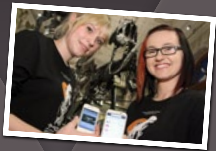
ModernMediaGuide, BRG Kandlgasse Wien